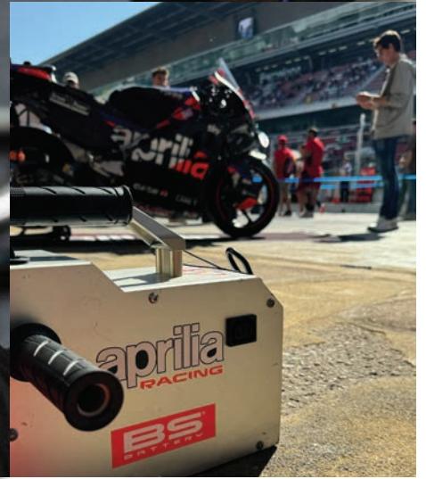
Su avanzada batería de litio BSLi-04/06 suministra a Aprilia desde la fábrica, garantizando rendimiento y fiabilidad para sus motos.

Sprint, pero se quedó fuera del podio en la carrera larga debido a problemas con el agarre del neumático trasero. A pesar de la frustración, Espargaró se mostró positivo, destacando el apoyo emocional del público y la experiencia inolvidable vivida en su circuito de casa.